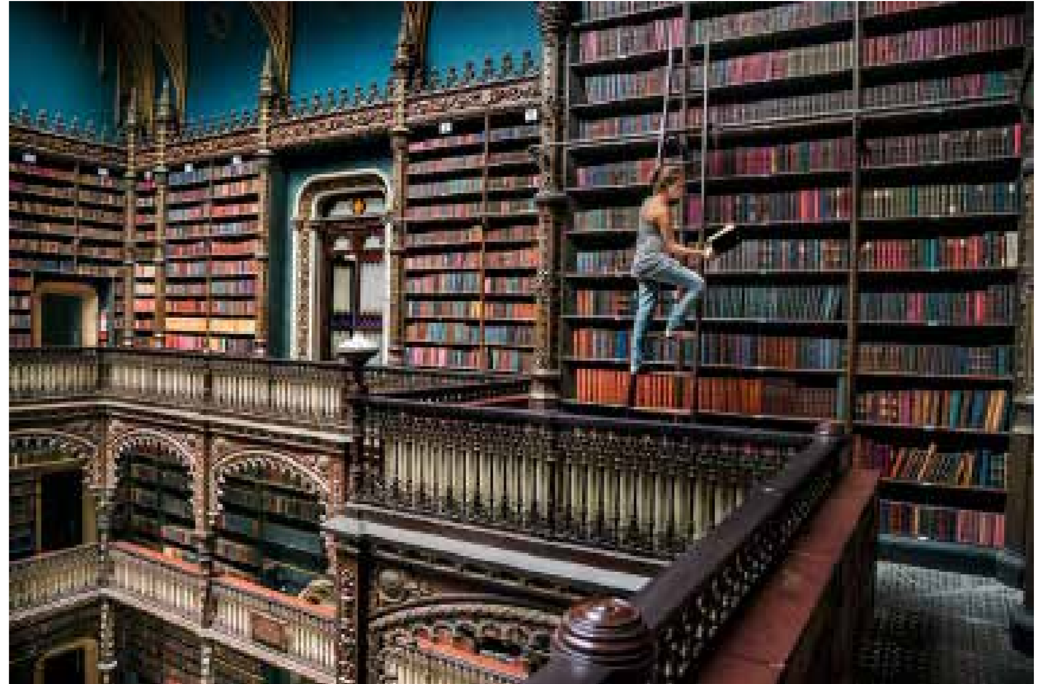
Real Gabinete Português de Leitura, Rio de Janeiro, Brazilië