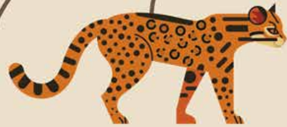
Geslacht Ocelot bv. oncilla of tijgerkat