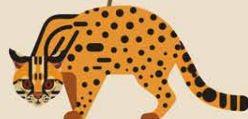
Geslacht Bengaalse tijgerkat bv. Bengaalse tijgerkat