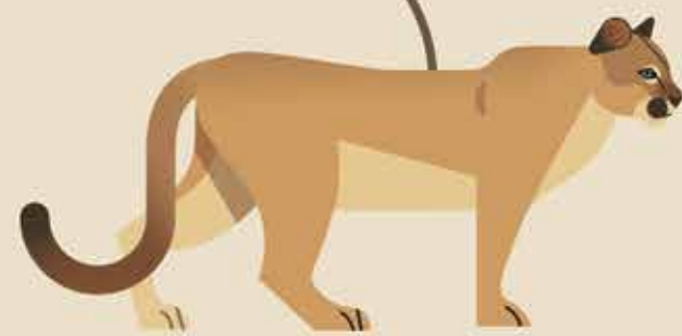
Geslacht Poema bv. poema