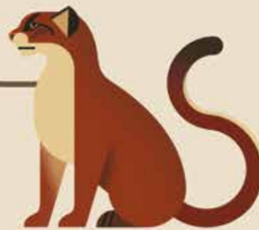
Geslacht Borneogoudkat bv. Borneogoudkat