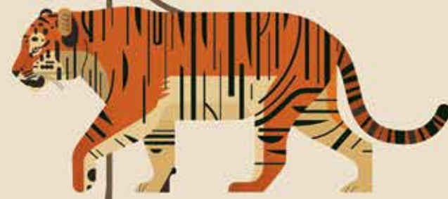
Geslacht Panthera bv. tijger

Er leven al circa vijftig miljoen jaar katachtigen op de wereld, maar de moderne wilde kat ontstond ongeveer zestien miljoen jaar geleden. Om beter te kunnen overleven veranderen dieren steeds; ze geven goede eigenschappen door aan de volgende generatie. We noemen dat evolutie. Moderne katten worden op basis van hun evolutie in acht groepen ingedeeld.