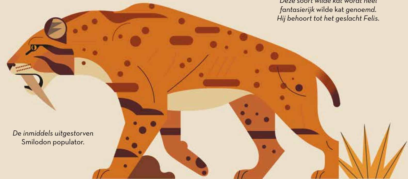
De inmiddels uitgestorven Smilodon populator.

Deze soort wilde kat wordt heel fantasieerijk wilde kat genoemd. Hij behoort tot het geslacht Felis.