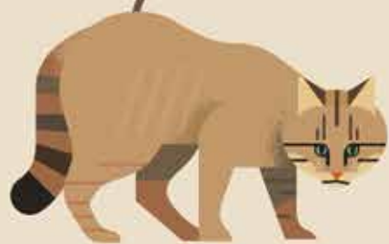
Geslacht Felis bv. Chinese bergkat