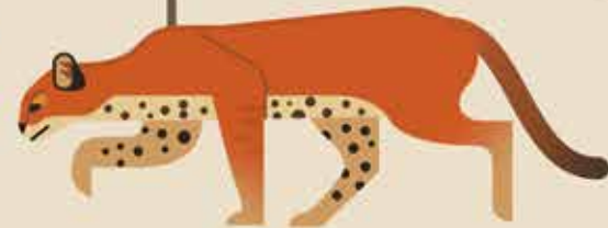
Geslacht Caracal bv. Afrikaanse goudkat